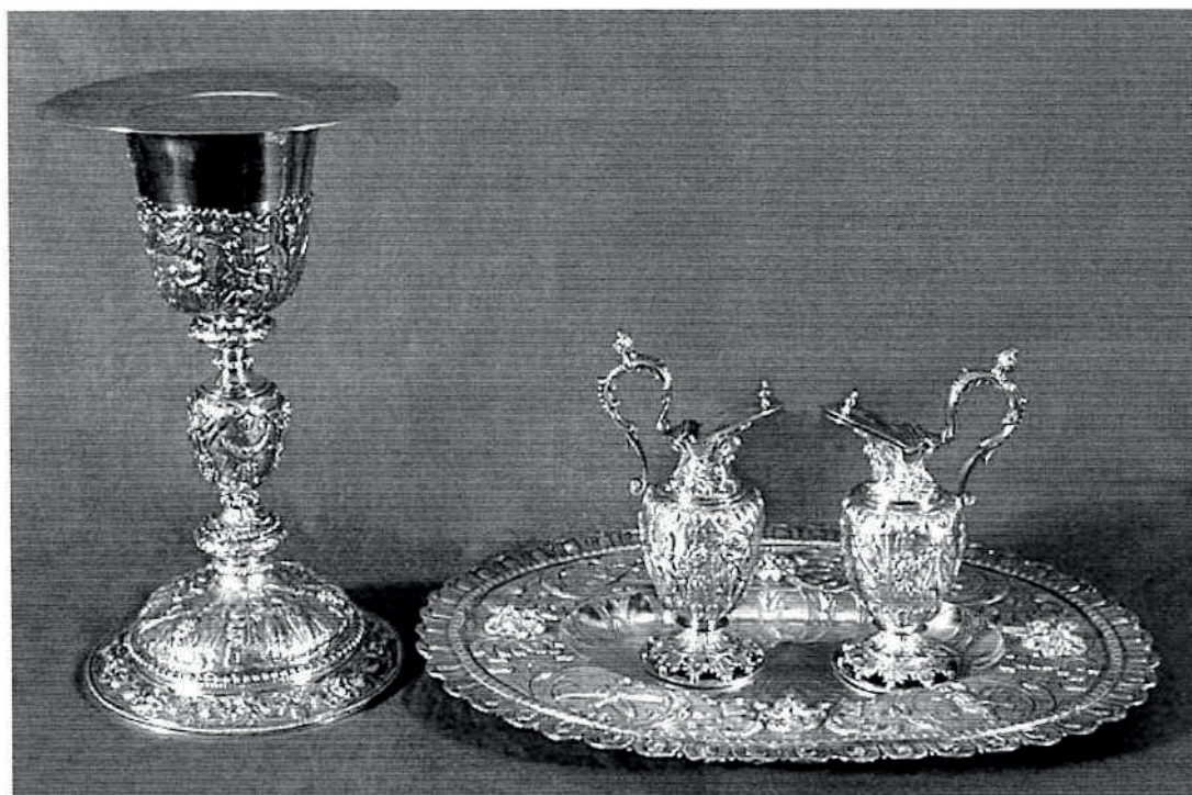
Calice et patène

À l'occasion de l'étude conduite par le département des objets d'art du musée du Louvre sur les collections du château de Grignan et la publication de leur catalogue ( Volutes d'époques. Le mobilier du château de Grignan , éditions Faton, 2010), cette chapelle d'orfèvrerie a été redécouverte. Une convention entre les châteaux de la Drôme et le musée du Louvre a permis de réaliser un échange de dépôts d'objets d'art entre les deux institutions : c'est ainsi que la chapelle vient de rejoindre nos cimaises, si pauvres en orfèvrerie française du xvii e siècle.