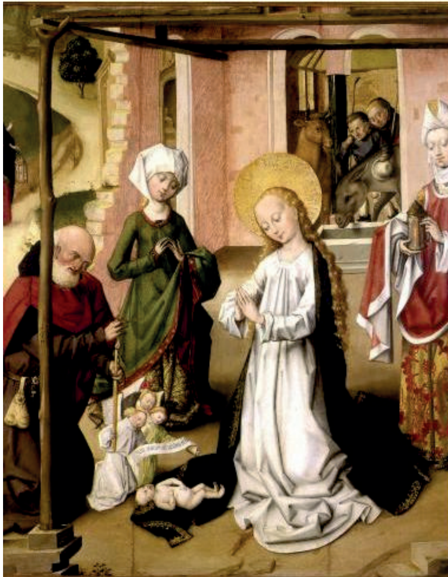
Huile sur bois, 0,71 x 0,62 mètres