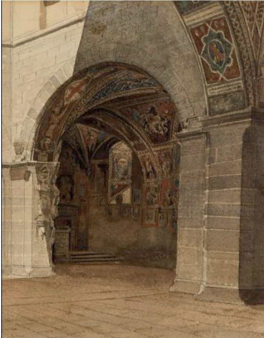
Aquarelle sur papier, 0,37 x 0,26 mètres