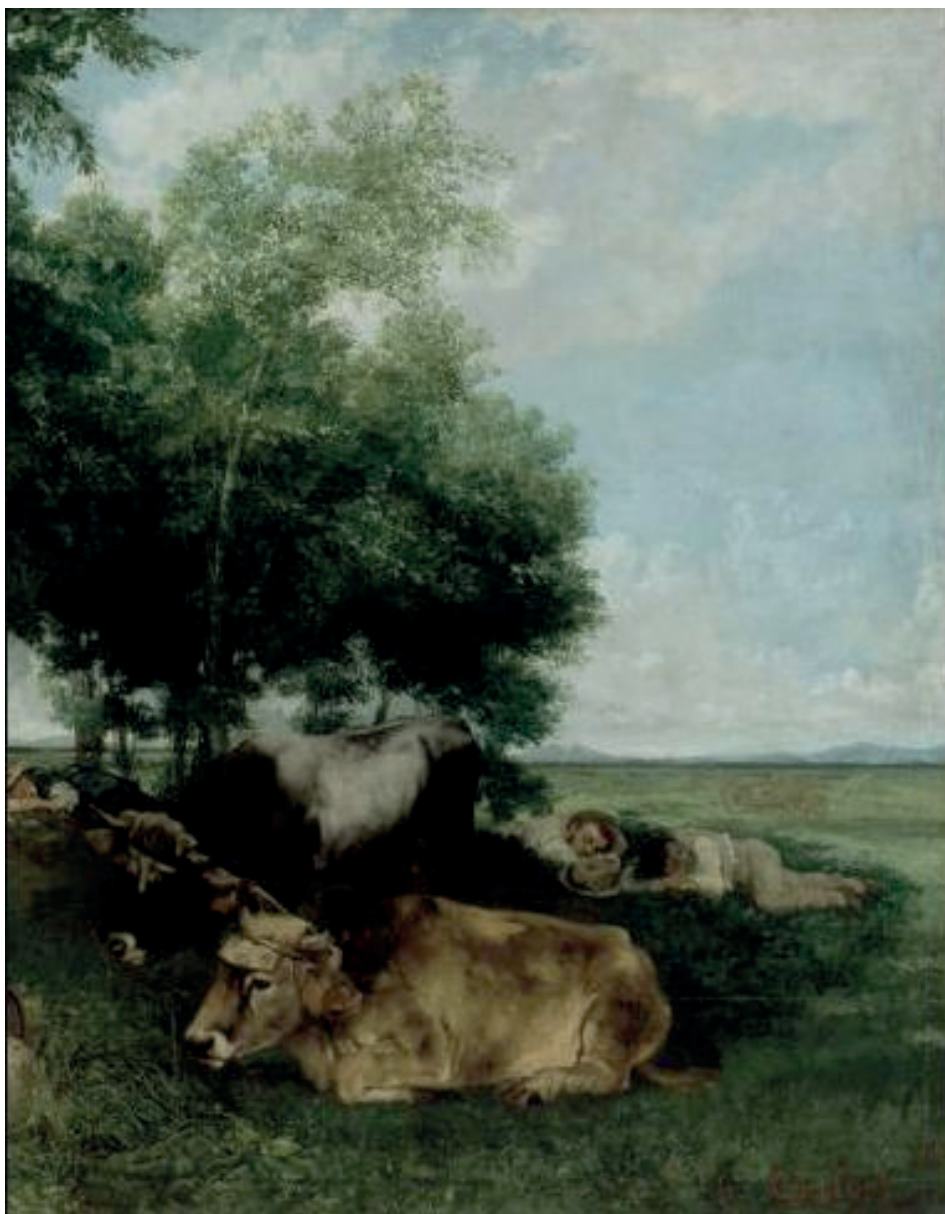
Huile sur toile, 2,12 x 2,73 mètres