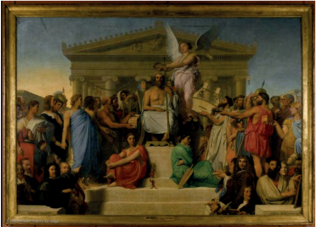
3,86 x 5,12 mètres