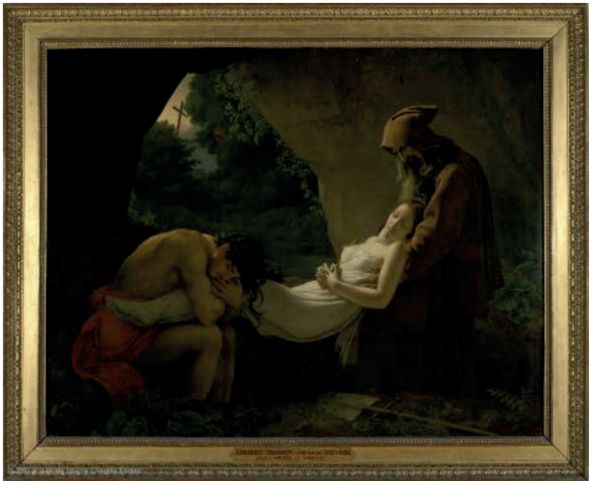
2,07 x 2,67 mètres