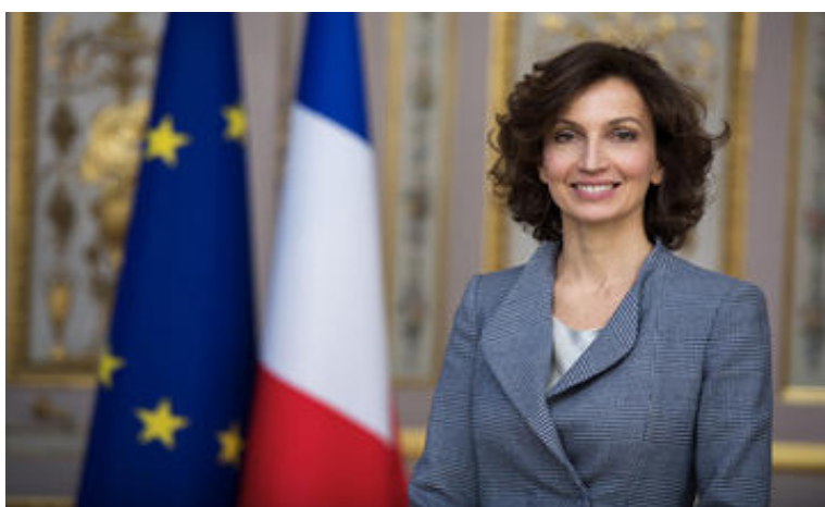
Audrey Azoulay

Pour sa première édition, le 14 janvier 2017, la Nuit de la lecture mobilise dans toute la France le monde du livre - bibliothèques, libraires, auteurs, éditeurs - afin de proposer au public un événement populaire autour de la lecture.