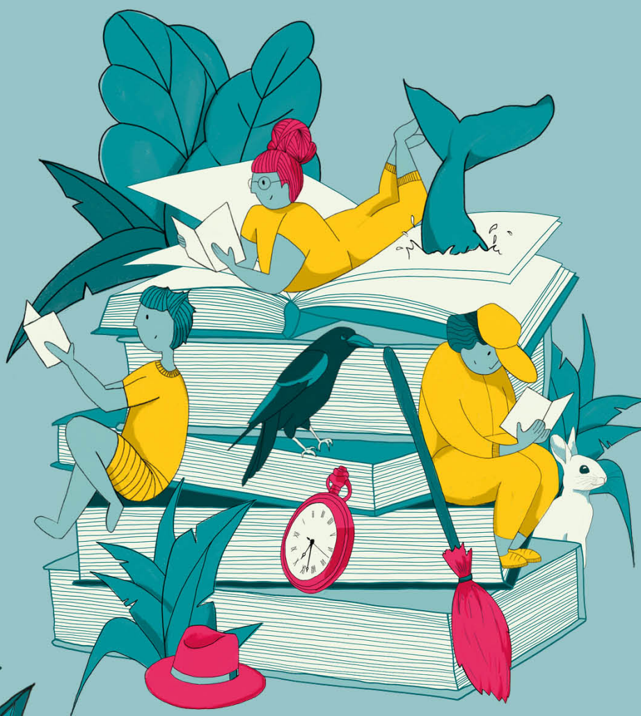
Illustration et design graphique : Thérèse Qua.

Rencontrez les univers du livre en Grand Est