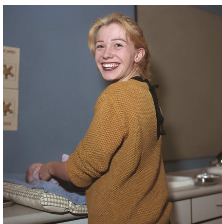
« Idaline, Donner le bain au nourrisson, CAP Petite Enfance, Mantes-la-Ville »

Des opérations phares ont été inaugurées comme l'Opéra-Comique, la salle Gémier du Théâtre national de Chaillot, la MC 93 à Bobigny, la Comédie de Saint-Etienne, le GMEM à Marseille, les espaces de répétitions et les bureaux des Tréteaux de France (CDN).