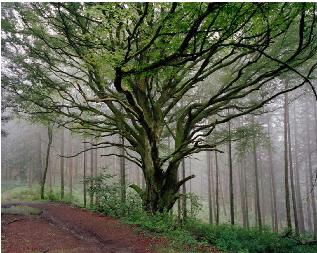
« Au bois »

Enfin en matière de numérique dont l'objectif consiste à placer la DGCA et ses réseaux d'établissements et de partenaires en situation de répondre durablement aux enjeux du numérique en matière de création, de diffusion et de relations aux publics, cette année a été plus particulièrement consacrée à la mise en œuvre du projet « Matrice Arts » en partenariat avec l'École 42, dont l'objectif visait à créer des prototypes d'applications numériques répondant à des enjeux thématiques attachés à la diffusion et la relation aux publics, dans les domaines des arts visuels et du spectacle vivant. Le dispositif a réuni des équipes étudiantes venues d'horizons complémentaires dans une démarche de transdisciplinarité : étudiants d'écoles supérieures d'art (École nationale supérieure des arts décoratifs et École nationale supérieure d'arts de Paris-Cergy), étudiants en informatique de l'École 42, étudiants en ingénierie culturelle de l'Icart, qui ont été accompagnés par 50 professionnels de la culture tout au long du processus afin de produire des propositions innovantes en phase avec les attentes du secteur. L'année 2018 permettra de développer des soutiens spécifiques aux projets innovants mêlant création et numérique.