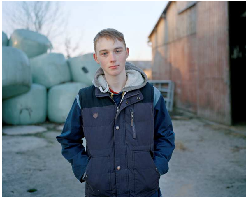
Tiré de la série « Territoires de jeunesse »

Enfin, la délégation à la musique a réalisé une étude avec le service de l'inspection de la création artistique dont l'objectif est d'explorer les modalités d'évaluation des actions de médiation en partant de cas concrets mis en œuvre par des établissements labellisés relevant de la DGCA.