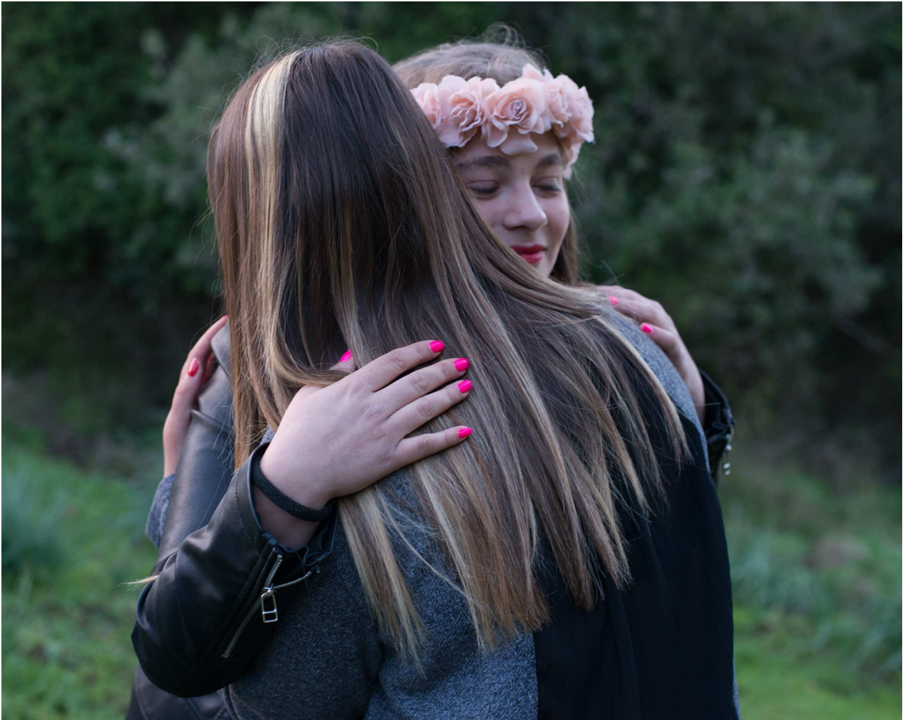
« Deux jeunes filles, Tamarone, janvier 2017 », tiré de la série « 180 km après la mer »

A l'heure actuelle, le centre estime à 55 % les agents de la DGCA qui font appel à la Documentation, dont 30 % de façon régulière.