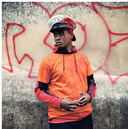
Tiré de la série « Des histoires d'amour à Marseille – Le mythe de Gyptis et Protis »

Enfin, la délégation a participé aux réflexions menées par la DGCA sur les filières : de l'enseignement initial à l'insertion professionnelle en passant par l'enseignement supérieur, en lien avec la sous-direction de l'emploi, de l'enseignement supérieur et de la recherche et la sous-direction de la diffusion artistique et des publics. La délégation assure par ailleurs le suivi des structures en charge de la formation permanente des artistes et de leur insertion professionnelle (Chantiers nomades, ARTA, JTN...).