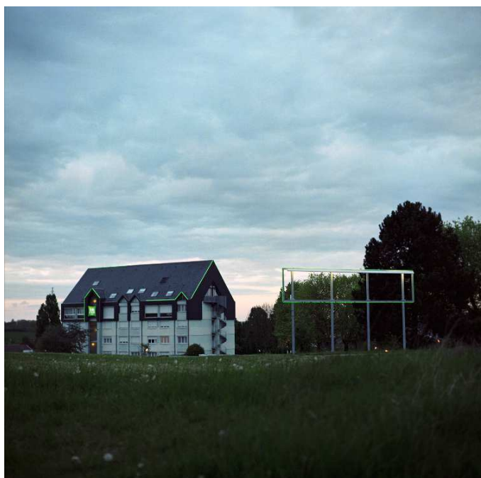
« Hôtel Mercure »

Sur le plan de la communication interne, la mission œuvre à la meilleure circulation de l'information avec notamment la diffusion hebdomadaire d'un compte rendu synthétique du comité de direction et d'une lettre d'information interne bimestrielle. Enfin, les Rendez-vous de la DGCA , moments d'échanges avec un invité extérieur sur une thématique donnée, ont connu en 2017 un nouvel élan en accompagnant les réflexions de la direction sur les publics et la médiation. Ainsi, cinq rencontres ont été programmées avec Marie-Christine Bordeaux sur « La médiation, la participation et l'inclusion au cœur des nouveaux enjeux des politiques culturelles », Patrice Meyer-Bisch sur « La création au regard des droits culturels », Hamid Salmi sur « La médiation culturelle en contexte thérapeutique », Luc Carton sur « L'actualité de la démocratie culturelle / Wallonie-Bruxelles » et Olivier Vadrot et Ingrid Brochard sur « Les dispositifs culturels mobiles ». Une dernière édition a traité de l'innovation dans les politiques publiques avec Stéphane Vincent, fondateur de l'association la 27 ème Région.