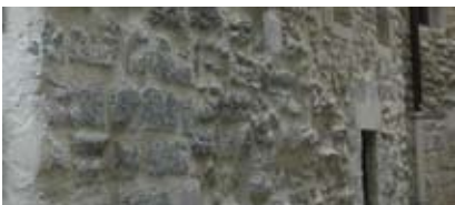
Le décroûtage: mauvaise image contemporaine du bâti ancien. Les joints de la maçonnerie pauvre sont beurrés et non en creux.