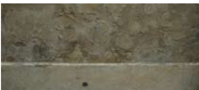
Les efflorescences: la peinture à la chaux et les enduits sont les couches sacrifiées qui luttent contre les sels.