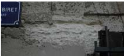
Le ciment (2) : L'enduit de ciment n'est pas assez perméant, et la pierre se dégrade au dessous et/ou au-dessus.