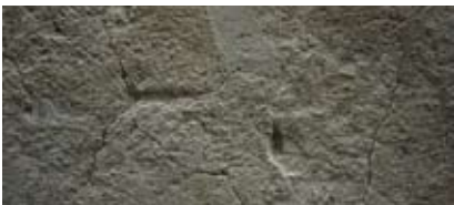
Le faïencage : dégradation accélérée de l'enduit par le faïencage, pathologie de mise en œuvre).