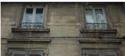
Les salissures : le nettoyage cosmétique, souvent à l'eau, remplace la couche traditionnelle de peinture à la chaux