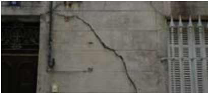
Le ciment (1) : L'enduit de ciment est trop dur pour la maçonnerie souple du bâti ancien.